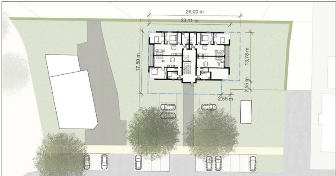
Aktueller Planentwurf des Vorhabens; Quelle: BBP Stadtplanung Landschaftsplanung, 05/2022

Die Stadt Ladenburg plant, einen bestehenden Bebauungsplan an aktuelle Gegebenheiten anzupassen und punktuell hinsichtlich der Gebietsausweisungen und zulässigen Nutzungen zu überarbeiten. Östlich des bestehenden Bestattungsunternehmens ist auf der noch unbebauten Fläche die Errichtung einer Sozialunterkunft für Geflüchtete und Asylbegehrende geplant.