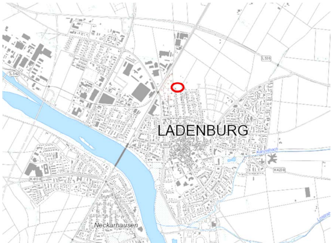
Lage des Plangebietes (rot gekennzeichnet) zur Ortslage von Ladenburg

Der Geltungsbereich hat eine Größe von etwa 0,35 ha und wird wie folgt abgegrenzt: