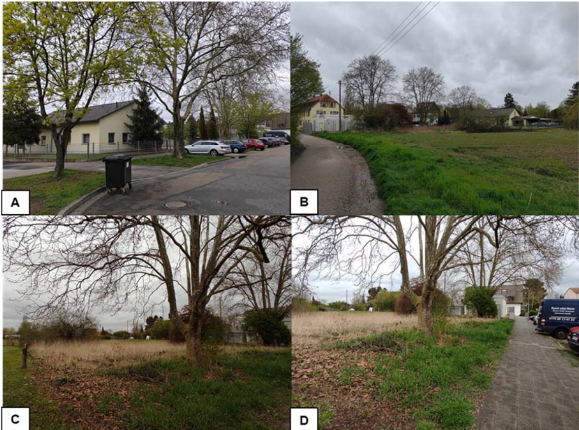
(A) Blick entlang des Alemannenwegs entlang nach Osten; (B) Blick von Norden auf das Plangebiet; (C) Blick auf noch unbebaute Fläche nach Norden; (D) Blick auf noch unbebaute Fläche nach Osten entlang des Alemannenwegs

Das Plangebiet ist nur von geringer Größe (0,35 ha) und umfasst dabei einen Teil des südlich verlaufenden Alemannenweges. Dieser Abschnitt des Alemannenweges umfasst auch einige öffentliche Parkplätze. Im Westen befindet sich ein Bestattungsinstitut und im Osten eine Gasreglerstation. Eine offene noch unbebaute Fläche befindet sich zwischen dem Bestattungsinstitut und der Gasreglerstation, welche nach Norden in die angrenzende Ackerfläche übergeht. Auf dieser Fläche finden sich auch kleinere Gehölze sowie zwei große, schön gewachsene Platanen (siehe nachfolgende Abbildung).