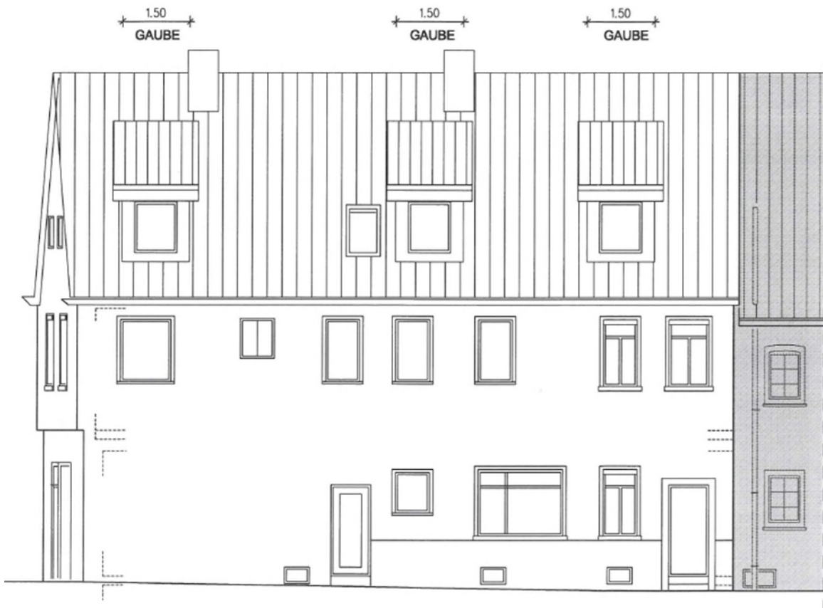
ANSICHT WEST ( KALTE GASSE )