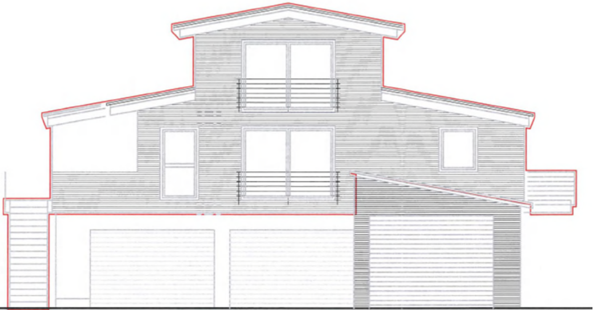
ANSICHT VON OSTEN – ANTRAGSTELLERIN